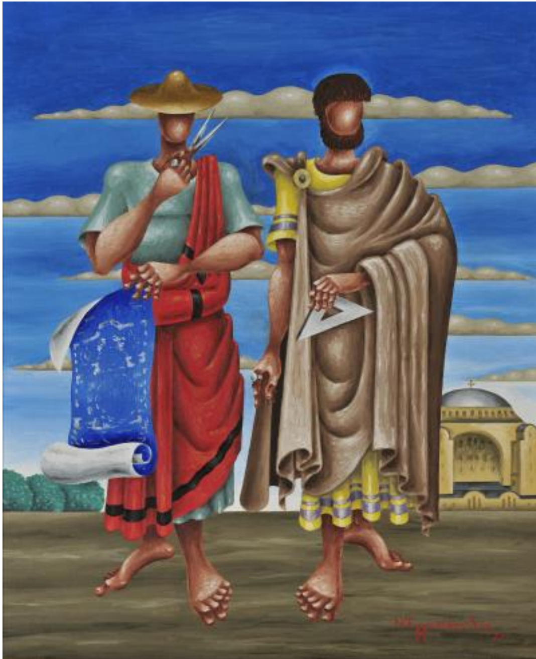
Άνθιμος ο Τραλλεύς και Ισίδωρος ο Μιλήσιος

http://corfu.nationalgallery.gr/test/-/asset_publisher/fVVV3WwjJcfy/content/anthimos-o-tralleus-kai-isidoros-o-milesios