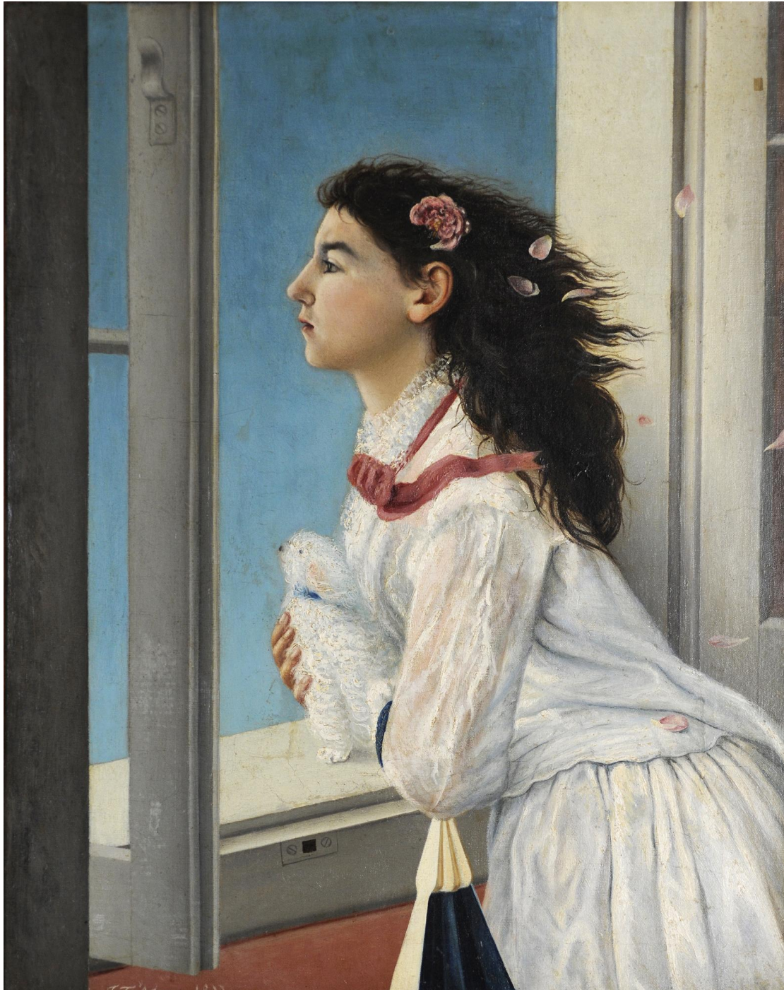
Κοπέλα στο παράθυρο

https://www.nationalgallery.gr/el/zographikh-monimi-ekthesi/painting/eptanisiaki-sholi/kopela-sto-parathuro.html